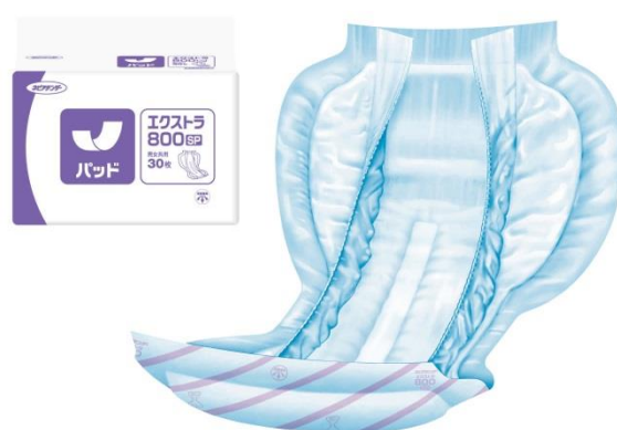
&lt;ネピアテンダー パッド エクストラ 800SP&gt;