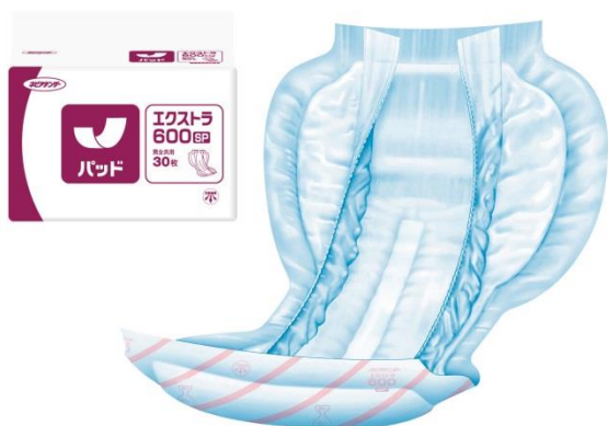
&lt;ネピアテンダー パッド エクストラ 600SP&gt;