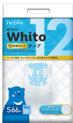
パッケージデザイン