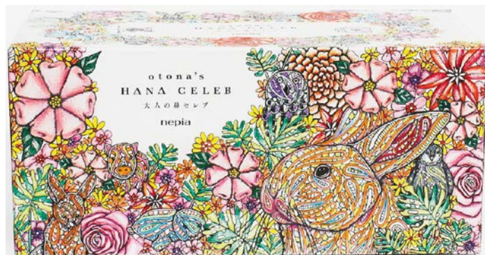
塗り絵を施した「nepia 大人の鼻セレブ」(イメージ)

今回起用したデザインは、テーマの通り塗り絵をお楽しみいただくこともできるよう、パッケージの品質にもこだわっております。美しく彩るコツとして、芯の柔らかい色鉛筆を使用するとより発色よく仕上がります。白基調のままはもちろん、ご自身で彩色をお楽しみいただき「世界でただ一つの大人の鼻セレブ」としてお楽しみいただくこともできる、大人の遊び心をくすぐる仕様となっております。