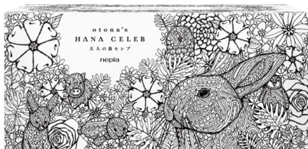
「nepia 大人の鼻セレブ」新パッケージ表

商品特長 : ① 鼻セレブ独自の「ダブル保湿成分(「ソルビット」「天然グリセリン」)」を配合したティッシュを3枚重ね、肌ざわりの“極み”を実現 ② デリケートな肌の方や、風邪や花粉症の方の鼻かみ、メイクケアにも最適 ③ イギリス人作家「ジョージ・ウールリッジ」氏の書き下ろしデザインを採用