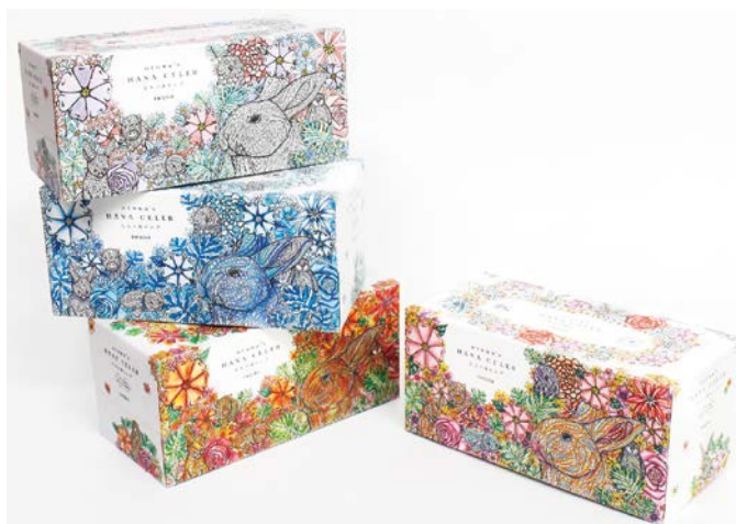
塗り絵を施した「nepia 大人の鼻セレブ」(イメージ)