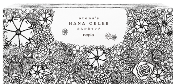
「nepia 大人の鼻セレブ」新パッケージ裏