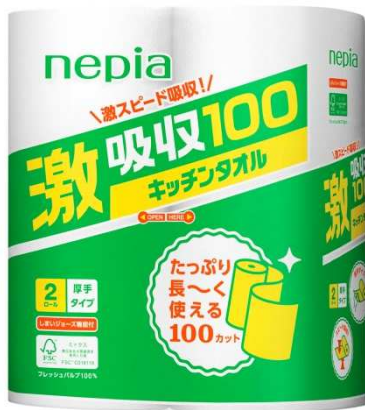
ネピア 激吸収キッチンタオル 100 2ロール

『ネピア 激吸収キッチンタオル 100』は、「品質の良いもの」を「たくさん、いろいろな用途に使いたい」というお客様のニーズにお応えした商品です。今回のリニューアルでは、これまでの高い吸収性能の品質はそのままに「たっぷり長く使える 100 カット」という商品特長を分かりやすくお伝えするパッケージデザインにしました。