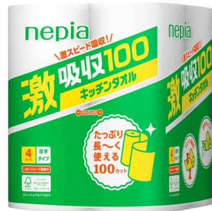
ネピア 激吸収キッチンタオル 100 4ロール