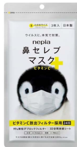
ネピア 鼻セレブマスク ビタミンC 小さめサイズ