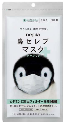
ネピア 鼻セレブマスク ビタミンC ふつうサイズ