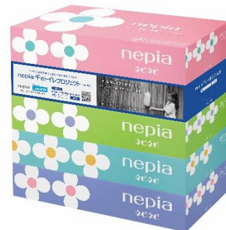
プロジェクト告知商品イメージ

「ネピア 千のトイレプロジェクト／第 13 フェーズ」では、2020年11月1日(日)から2021年1月31日(日)までのキャンペーン期間中の対象商品の売上の一部で、ユニセフの「水と衛生に関する支援活動」をサポートし、アジアで一番若い独立国である東ティモールを支援対象国として、屋外排泄の根絶と衛生意識の向上や衛生環境全般の改善を目指します。キャンペーンを広く知っていただくために、プロジェクト告知商品を日本全国で数量限定販売いたします。告知商品のパッケージには写真家・小林紀晴氏の写真を起用し、販売店のご協力のもと、店頭を通じた告知活動を行い、世界の「水と衛生の問題」への関心を高め、理解を深めることに努めてまいります。