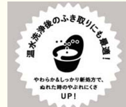
温水洗浄後のふき取りにも最適! パッケージ告知マーク

そして、この秋、高密度ソフトエンボス加工に加え、『やわらか&しっかり新処方』で、濡れた時のやぶれにくさをアップさせ、温水洗浄後のふき取りにも、より使いやすい紙質となりました。