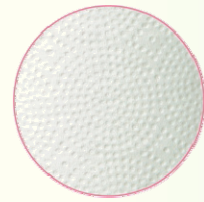
高密度ソフトエンボス加工

2011年春、やわらかさにこだわりつづけるネピアがトイレットロールに採用したのが、高密度ソフトエンボス加工。1cm 2 あたりのエンボス数が表裏あわせて最大 81 ポイントと、当社従来品比で 2.5 倍以上のエンボス数となりました。