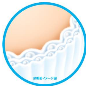
<「3層構造空気クッション」イメージ図>

また、おむつの替え時がわかりやすいと好評の2本の「おしっこシグナル」は継続採用します。