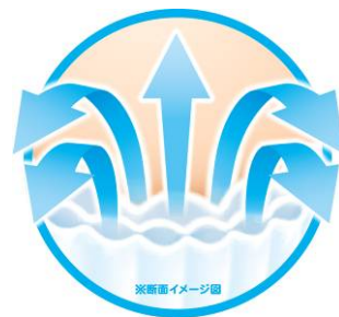
<「おなか通気ウェーブ」イメージ図>