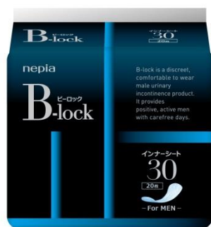
<nepia B-lock インナーシート 30>