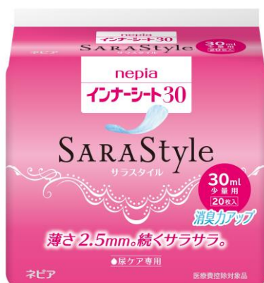
nepia インナーシート SARASStyle 30