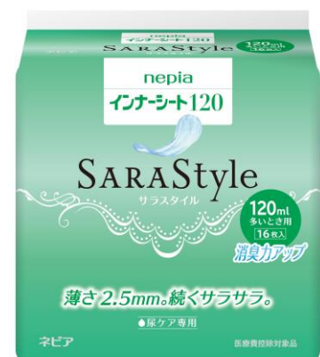
nepia インナーシート SARASStyle 120