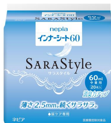
nepia インナーシート SARASStyle 60