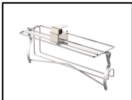
① 片手で切れるキッチンペーパーホルダー【ヨシカワ】

…カトラリーホルダー付の深さのある耐熱フラッターボウルとフラッタープレートセットをプレゼント。