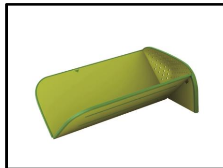
②リンス&チョップ プラス (折りたたみ機能付きまな板) 【Joseph Joseph】