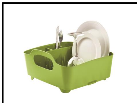
③タブディッシュラック 【umbra】