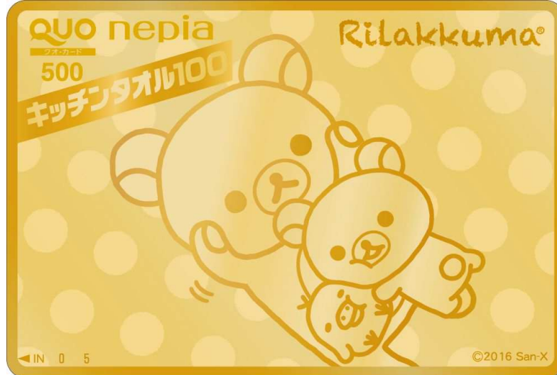
リラックマ金のQUOカード500円分(99名様)

※賞品の純金100万円については、2016年10月時点での純金の価格に基づいています。※賞品画像はイメージです。実際とは異なる場合がございます。