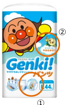
<②やわらかさの訴求>