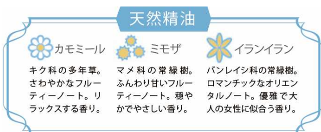
「フラワーシンフォニーの香り」 30～40代女性 モニター調査