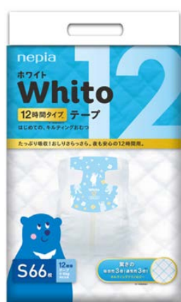
パッケージデザイン