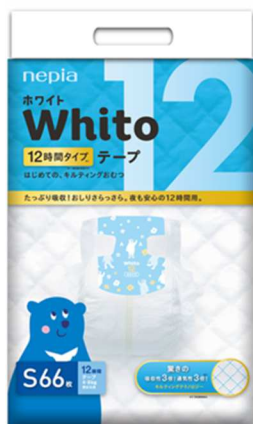
パッケージデザイン