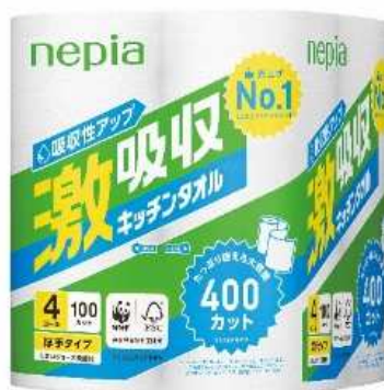
ネピア 激吸収キッチンタオル 400 カット