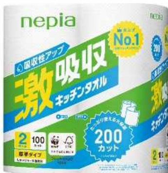
ネピア 激吸収キッチンタオル 200 カット

また、取り出しやすくさっと使えるボックスタイプを同ブランドで新たにラインアップに加え、お客様の幅広いニーズにお応えいたします。