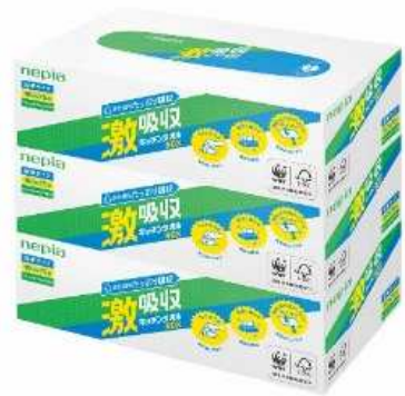
ネピア 激吸収キッチンタオル ボックスタイプ