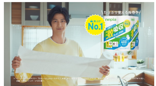
速水もこみちさんオススメの 「ネピア 激吸収キッチンタオル」は、 長巻きキッチンタオルで売上げNo.1※!

本ムービーは「夫が、新しい激吸収を買ってきた。」の一言ではじまる、もしも速水もこみちさんが夫だったら……という女性視点でキッチンでのひとときが描かれており、速水さんには夫役として「ネピア 激吸収キッチンタオル」の魅力をご紹介いただきました。至近距離で速水さんに見つめられ、優しく話しかけられ、ドキドキしてしまうこと間違いなしの“妄想”ムービーとなっています。お料理など家事の合間のちょっとした休憩時間に、ぜひ本ムービーをご堪能ください。