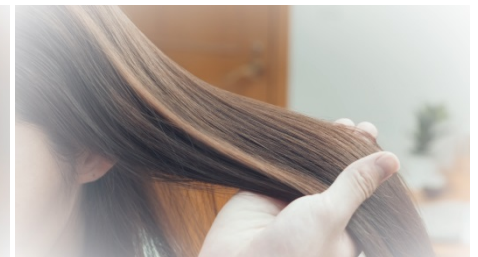
「たっぷり使える長巻き」は 長い髪の毛に重ねて表現。速水さんに優しく撫でられている気分が 味わえます

さらに 5 月上旬より、ムービーを視聴後、内容に関するクイズにお答えいただくと、新しくなった「激吸収シリーズ」の詰め合わせセットや、速水さんのサインと「夫からのねぎらいの言葉」がコンセプトの直筆メッセージ（例：いつも家事おつかれさま！ など）、QUO カード（500 円分）が当たるプレゼントキャンペーンを開催いたします。キャンペーンの詳細は次のページをご覧ください。皆様のご応募をお待ち申し上げます。