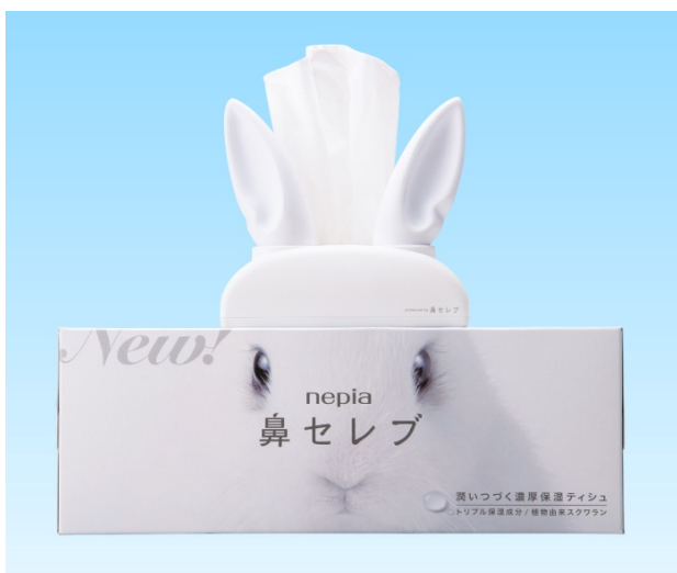
「おしゃべり鼻セレブ うさぎ」