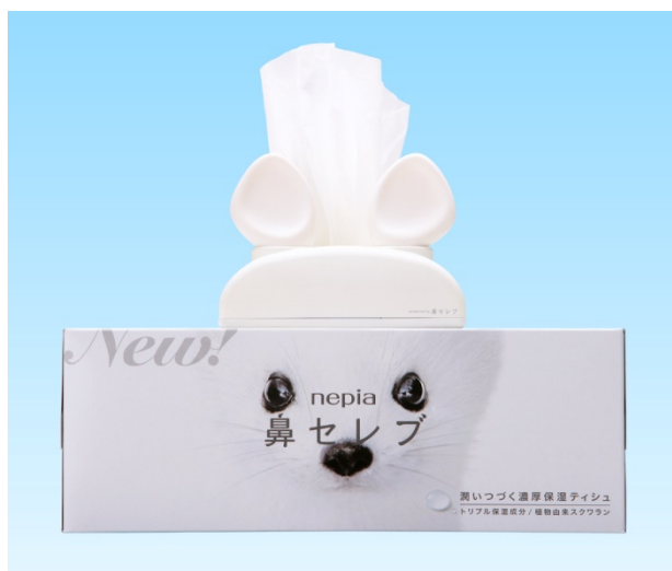
「おしゃべり鼻セレブ イイズナ」