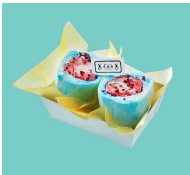
涙目うさぎの 「グレープ&グレープ」

エスプレッソの風味に、マスカルポーネチーズのコクをプラス。ブルーとゴールドのアザランをトッピングしました。その見た目はまるで氷の上に優雅につるぐアザラシのよう（?）。あなたの心も癒やされることでしょう。