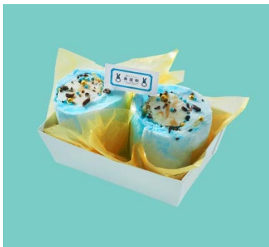
麗しアザラシの 「ビターティラミス」

エスプレッソの風味に、マスカルポーネチーズのコクをプラス。ブルーとゴールドのアザランをトッピングしました。その見た目はまるで氷の上に優雅につるぐアザラシのよう（?）。あなたの心も癒やされることでしょう。