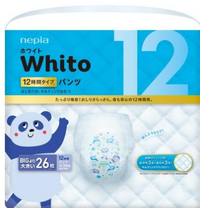
<パンツ BIG より大きいサイズ 12 時間タイプ>

王子ネピア株式会社(本社：東京都中央区、代表取締役社長：用名 浩之)は、赤ちゃん用紙おむつ『ネピア White(ホワイト)』の新商品「パンツ BIG より大きいサイズ 12 時間タイプ」を、2020年6月より日本国内および中国にて発売開始いたします。