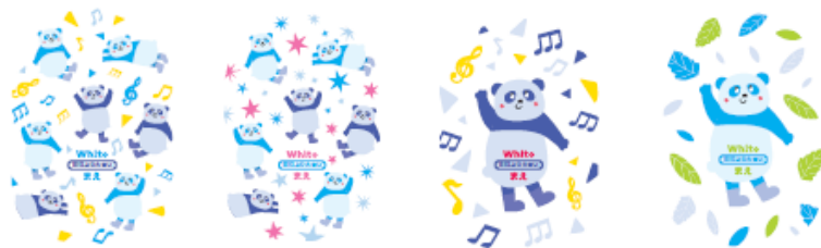
<おむつデザイン：全8種>