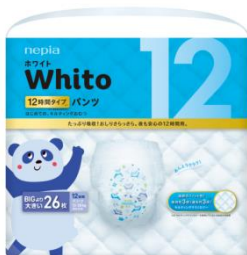
<パッケージデザイン>

パンツ BIG より大きいサイズには、パンダを動物アイコンとして採用しました。また、おむつ柄は、月齢の高いお子さまにも親しまれるデザインに仕上げました。