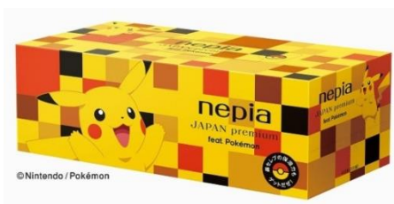
ボックスティッシュ1コ (市松模様)