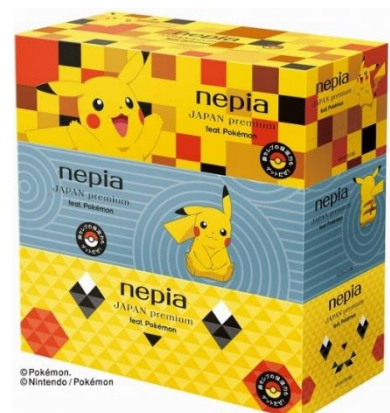
ボックスティッシュ3コパック No.2 (市松模様、枯山水、折り紙 各1コ)