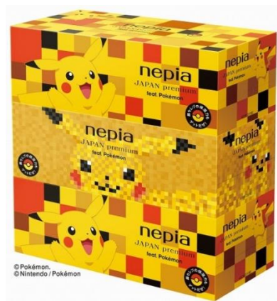
ボックスティッシュ3コパック (市松模様2コ、寄木細工1コ)