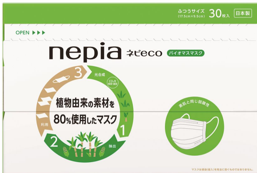
ネピア ネピ eco バイオマスマスク 30枚入（10枚×3パック）

配送方法：ご自宅のポストに投函いたします。ポスト投函タイプだから、受取もらくらく。