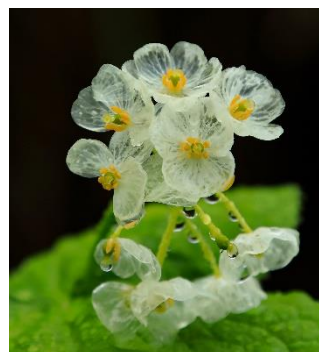
梅池自然園のサンカヨウ

「サンカヨウ」は、使用パルプの最適化と抄紙技術の検討で特定樹脂の浸透性を高め、より効率よく透明化させることが可能です。また、リサイクル時の離解性を向上させ、透明化してもリサイクルが可能な新規包装用紙です。