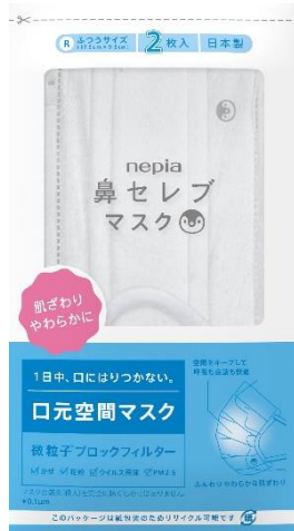
「ネピア 鼻セレブ口元空間マスク 紙エールパッケージ」

王子ネピア株式会社（本社：東京都中央区、代表取締役社長：用名浩之）は、兼ねてより販売中の「ネピア 鼻セレブマスク」シリーズに、リサイクル可能で環境に配慮した紙製パッケージ品「ネピア 鼻セレブマスク 紙エールパッケージ」を追加ラインナップいたします。まずは法人向けのノベルティ商品として、5月下旬より取り扱い開始予定です。