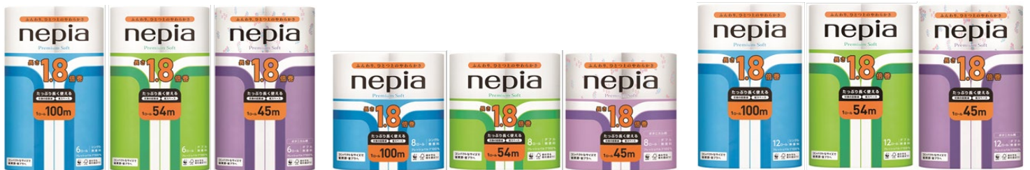
＜ネピア プレミアムソフト 1.8 倍巻 6 ロール＞

2020 年に「ネピア プレミアムソフト トイレットロール 2 倍巻(ダブル・ポタニカル柄)」の発売以来、シングルも欲しいというご要望を数多くいただき、長巻シングルの開発を進めてまいりました。この度、プレミアムソフト トイレットロール 12 ロール 55mシングルと同等の品質で長巻化の実現に至り、プレミアムソフトブランドから 1.8 倍巻シングル(100m)をラインナップした「1.8 倍巻シリーズ」を新発売いたします。