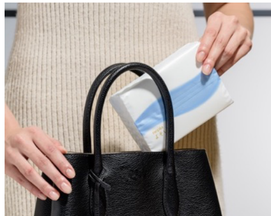
（左）「ネピア よそいき保湿ソフトパックティッシュポケットイン 50組5コパック」 （右）「ネピア よそいき保湿ソフトパックティッシュバッグイン 90組5コパック」