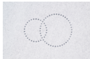
水玉パターンエンボス

なめらかなティッシュを3枚重ねました。おでかけ先でも、重ねずひと組で使える安心感ある厚み。水玉パターンのエンボス加工で剥がれづらく、さっと広げることができます。