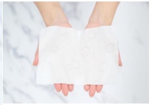
よりコンパクトな一方、厚みのあるバッグインタイプ