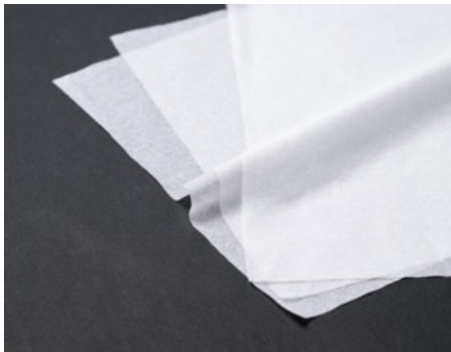
三枚重ねでしっかりした厚み