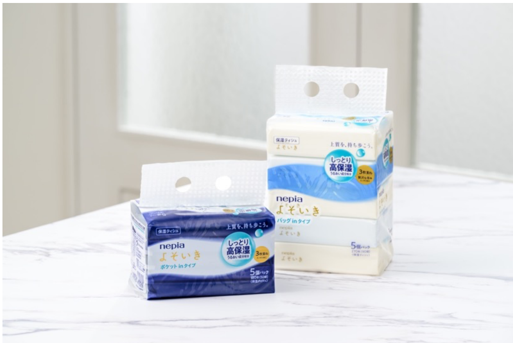
（左）「ネピア よそいき保湿ソフトパックティッシュポケットイン 50組5コパック」