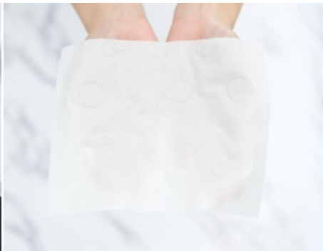
大きめ判のポケットインタイプ