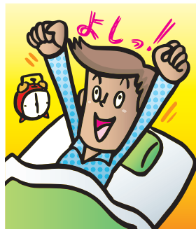
監修:牧野修玄 (ヨガ・瞑想・ホテコンディショニング講師)

「返ったかしら」と振り返って下さい。そして「ゆっくり休んでね」と自分をいたわりましょう。すると朝の目覚めが変わります。がんばる力も、自然についてきます。 日中は、自分を「いい言葉」でいっぱいにしてみましょう。誰でもついでにしようというネガティブな言葉は、長年の癖。やめるには無理がありません。でも、いい言葉を積極的に使うようにすると、ネガティブな言葉の割合が自然に減ります。それは、介護をする相手にかける言葉にも反映されるでしょう。三日坊主でかまいません。ぜひ実行してください。